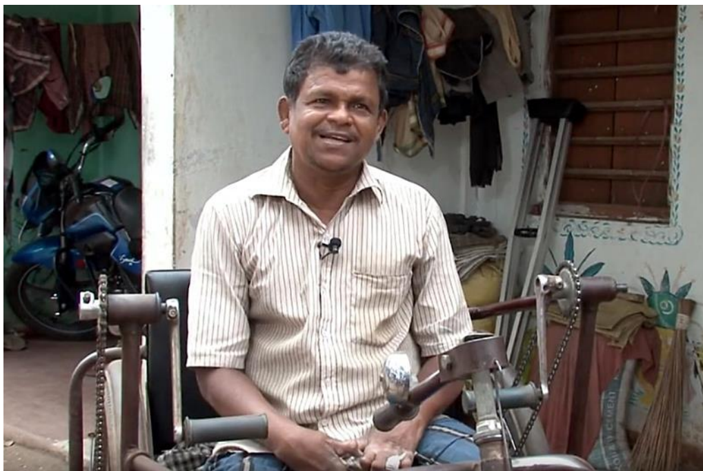
Kadr z filmu "Miłość bez granic"; prod. Ishvani Kendra Production