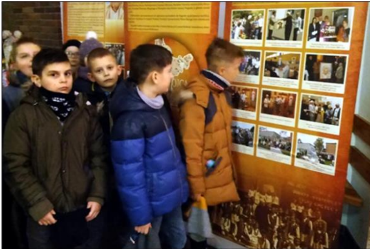
Wystawa w kościele parafialnym

GOŚCIEM REKOLEKCJI BYŁA PREZES Fundacji Redemptoris Missio , która opowiedziała o swoim pobycie w Indiach. Przybliżyła postać o. Mariana i jego liczne dzieła, a szczególnie Szkołę Beatrix w Purii.