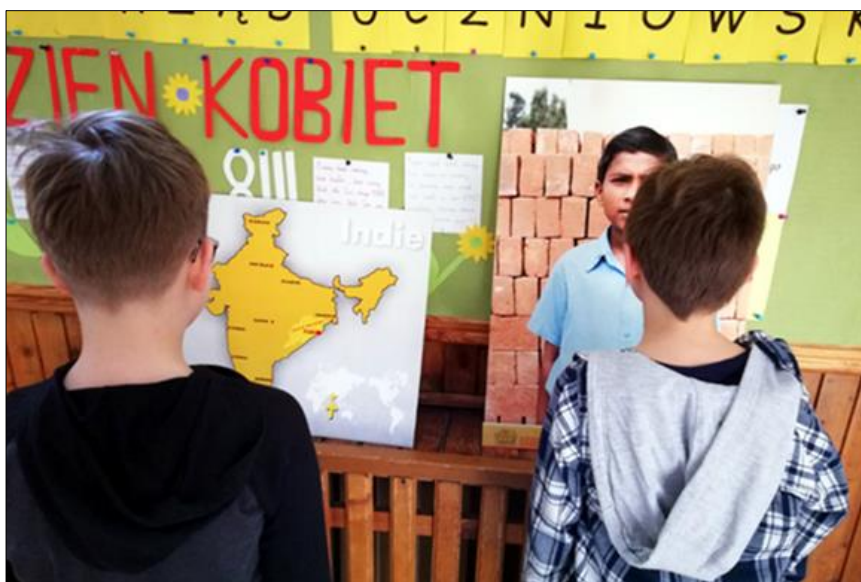
Wystawa o Indiach w szkole

W kościele dzieci obejrzały WYSTAWĘ dotyczącą życia i działalności o. Mariana, a w szkole kolejną, dotyczącą Indii i miasta Purii, gdzie misjonarz pracował wśród trędowatych.