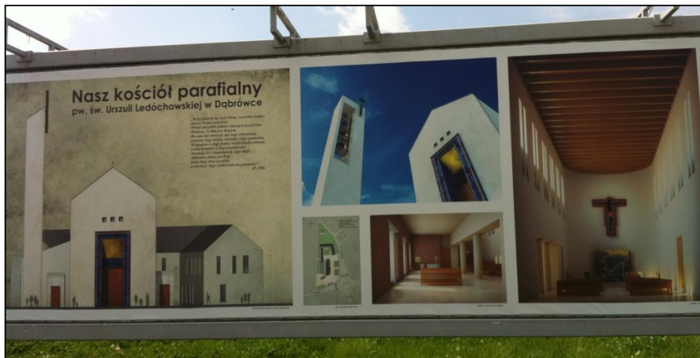
Ryc. Projekt nowego kościoła parafialnego pw. św. Urszuli Ledóchowskiej w Dąbrowce